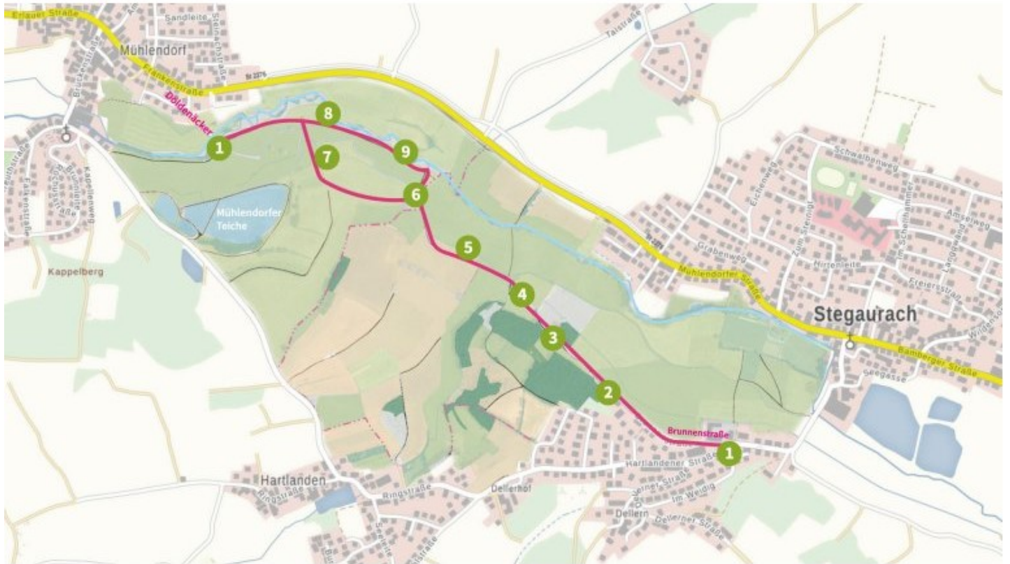
Grafik: Eigentum der Gemeinde Stegaurach—darf mit freundlicher Genehmigung hier abgedruckt werden